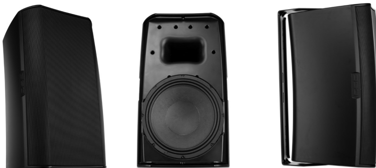
Montaje de Yugo (incluido)