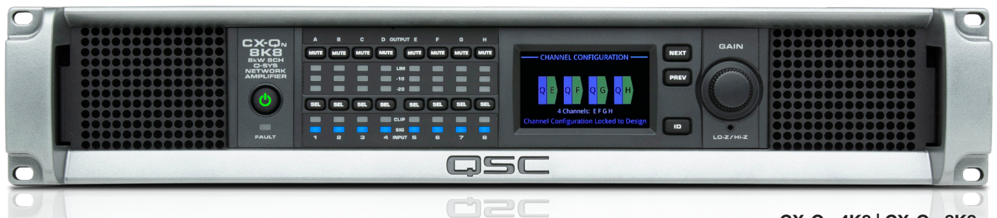
CX-Qn 4K8 | CX-Qn 8K8